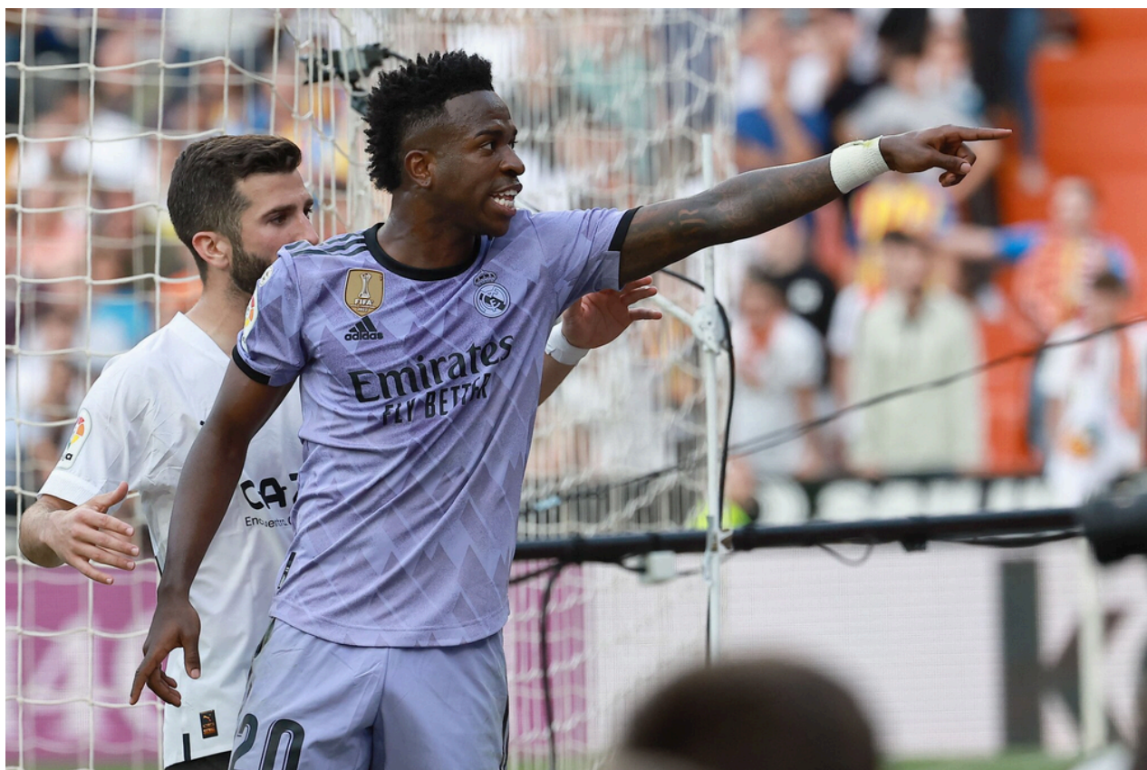
Vinicius Júnior, jugador del Real Madrid, señala a un grupo de aficionados del Valencia que, asegura, le llamaron mono.

El deporte es una herramienta espectacular para la movilización de emociones y sentimientos, pero también una oportunidad única para aprender a gestionarlos y orientarlos hacia la adquisición de los valores que conlleva la práctica de cualquier actividad deportiva. La palabra violencia designa toda agresión física inaceptable con vistas a herir o intimidar al adversario sobre el terreno de juego o fuera de él, y también la agresión psicológica (McIntosh, 1990). Según la memoria 2019-2020 de la Comisión Estatal contra la violencia, el racismo, la xenofobia y la intolerancia en el deporte (CSD), el 91,34% de los incidentes producidos con intervención de las fuerzas y cuerpos de seguridad del estado han sido en partidos de fútbol de ámbito no profesional, mientras que el 8,66% restante se han dado en otros deportes.