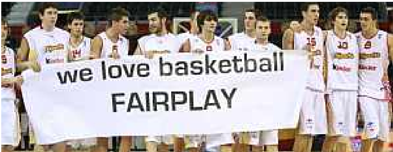
Los jugadores españoles exhiben una pancarta durante el encuentro frente a Turquía.

Todos los valores expuestos se dan la mano en el concepto de deportividad. La esencia de la misma es el juego limpio, ese que reconoce la importancia del respeto a las normas y al espíritu del juego, así como a los adversarios (que son compañeros de juego) y al árbitro (juez y máxima autoridad del partido). Si no actuamos con deportividad, es que realmente lo que estamos practicando no es un deporte.